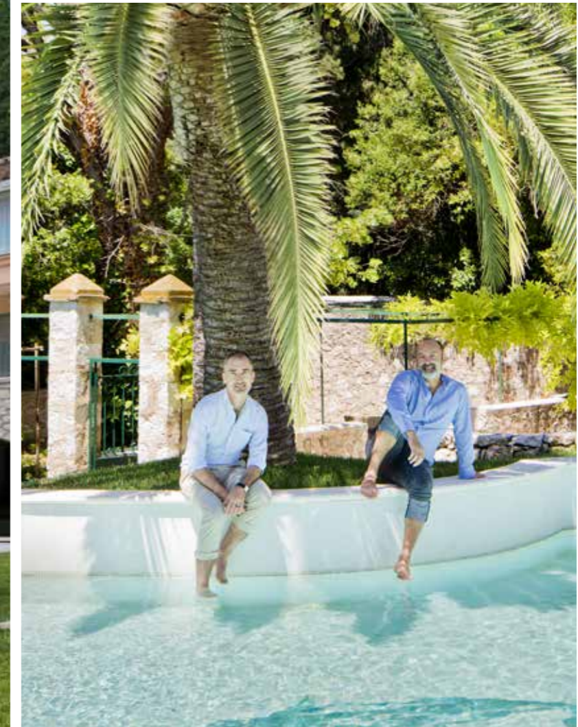
A SINISTRA, IL PARCO CHE CIRCONDA LA VILLA CON LA GRANDE PISCINA. SOPRA, I DUE DESIGNER CIARMOLI E QUEDA. PAGE, GENDI NOBIS ENIS SIMILIQUI SIM ID MAGNIAERO AUTE ET ULLABORRUM FUGIATE ELITECEPEDIT AMET LAM REPED QUI